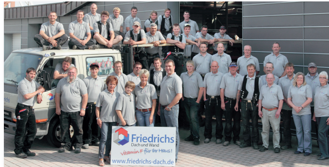
Mehr als 40 Friedrichs-Mitarbeiter und Familienmitglieder – das starke Team für alle Arbeiten rund um Dach und Wand

Sie erreichen uns mit dem Auto schnell und bequem aus allen Richtungen über die B54